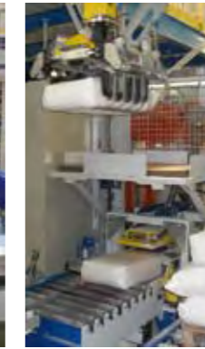
Planchador de tipo vibrante