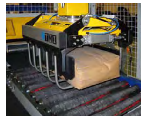
Pinza manipuladora de sacos