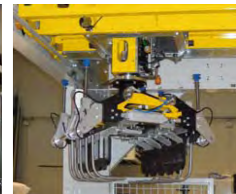
Pinza manipuladora de sacos y láminas de cartón