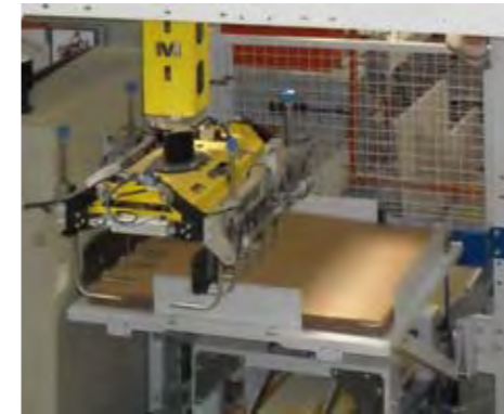
Almacén de láminas de cartón