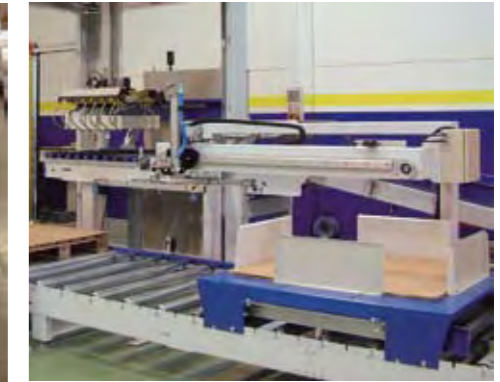
Dispensador de láminas de cartón