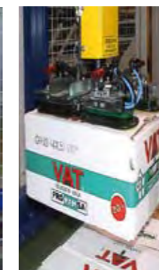
Pinzas para cajas