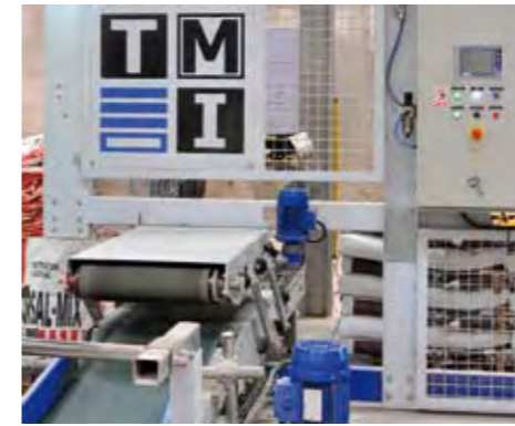
Planchador de banda motorizada