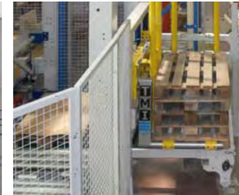
Dispensador de palets