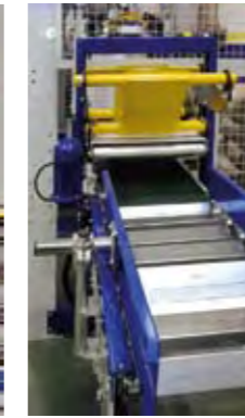
Acondicionador de sacos de rodillos cuadrados y libres