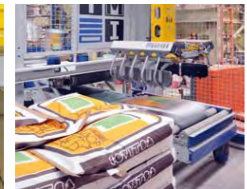
Estación recogida de sacos llenos