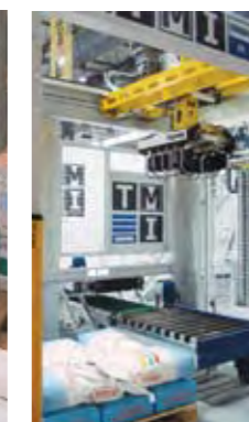
Paletizado al suelo