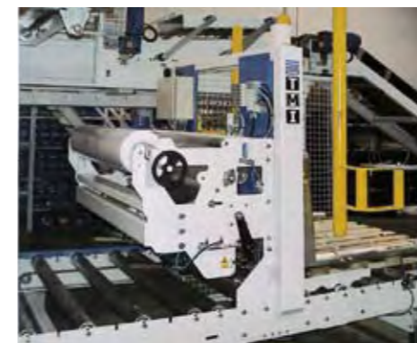
Dispensador de film de PE