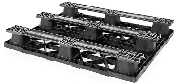
SOPORTE: 3 PATINES